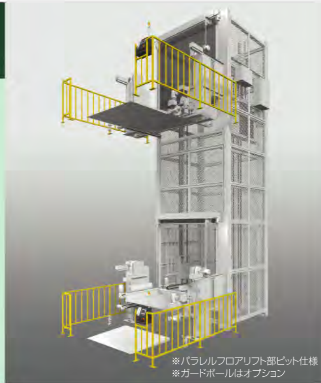
※平行フロアリフト部ピット仕様 ※ガードポールはオプション

[低上部]は、設置建屋の最上階天井高さが低い現場に対応できる機種で、天井高さが3,700~6,000mmの範囲であれば設置可能です。