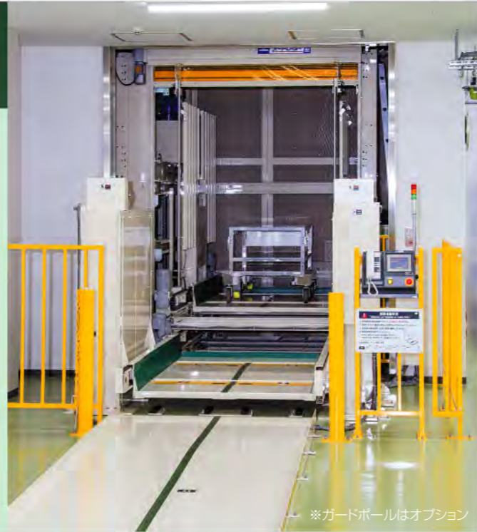
※ガードポールはオプション

フロア循環は、パレットだけでなく様々な形態の搬送物(台車・袋物など)を垂直自動搬送できます。複数枚のフロアパレット(フロア状専用荷受台)が循環するしくみで、各間口(搬入出口)にオートアシスター(自動搬入出コンベヤ)およびフロアリフト(自動搬入出レベル調整装置)が設置され、最大5パレット分を機内に留めることができるプールタイプです。 例えば、作業者が1人の場合でも、1階から複数パレット分をまとめて搬入(機内にプール)し、満杯になったら行先階に移動してまとめて搬出することで、効率的に入出庫作業を行なうことができます。 多階層の物流倉庫や配送センター・工場はもちろん、低温倉庫(冷蔵・冷凍環境)や危険物倉庫(防爆環境)など様々な環境に対応できるノウハウと豊富な実績があります。 【低上部】は、設置建屋の最上階天井高さが低い現場に対応できる機種で、天井高さが3,500~6,000mmの範囲であれば設置可能です。